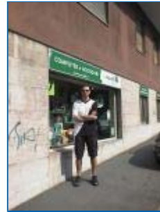
Il nostro inviato sa che sarà una giornata mooolto calda...