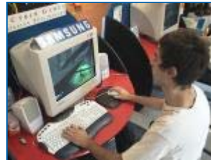
Il vice campione di Unreal in azione!

Tutta questa fatica per la gloria e per la bandiera ma soprattutto per i 300.000 dollari di montepremi messi in palio dall'organizzazione. Protagonisti dei World Cyber Games sono, oltre ai partecipanti e agli sponsor, i giochi che decreteranno i vincitori attraverso tesissimi deathmatch con Quake 3 Arena ed Unreal Championship. La prima gara di selezione a Varese ha registrato circa un centinaio di iscrizioni via web più quelle di alcuni audaci gamers accorsi all'ultimo momento all'Essedi. La mia speranza, da buon varesino, è quella che tra qualcuno di questi si nasconda il futuro campione mondiale delle due specialità, risultato che porterebbe la selezione italiana a fare meglio rispetto alle due medaglie d'argento conquistate l'anno scorso. La strada verso i trionfi coreani è però ancora lunga e per tutta l'estate vi terremo informati sui risultati delle singole tappe. Buoni World Cyber Games a tutti!