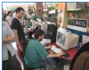
La folla guarda incuriosita...e un pò invidiosa!