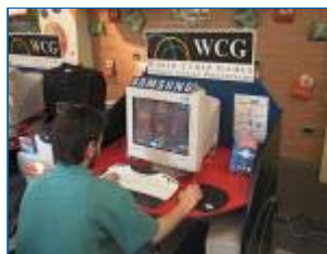
Lotta all'ultimo frag!

Home Page | Old News | Network | Forums | Files | Contatti | Staff