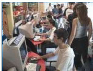
Uno dei momenti di gioco.