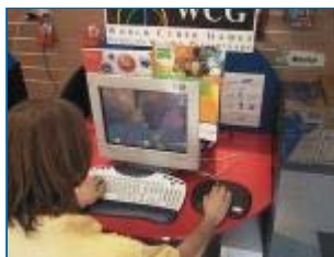
I computer a disposizione dei giocatori erano davvero potenti.